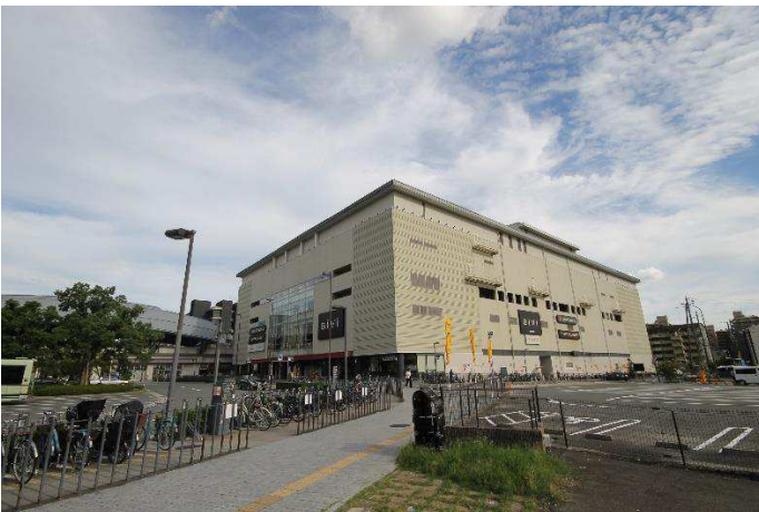
B i V i (映画館等複合商業施設)