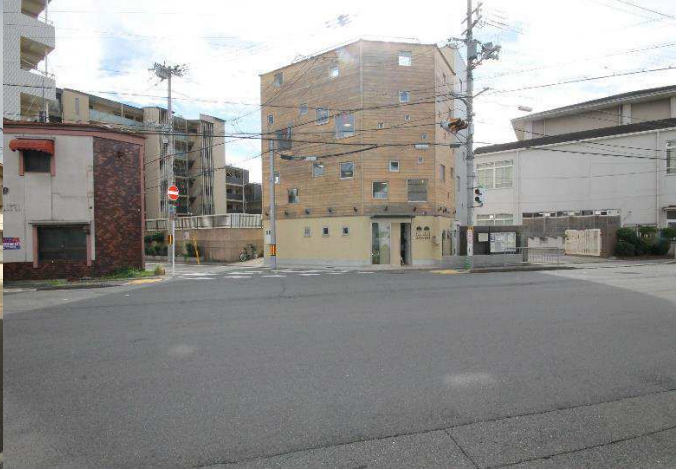
朱雀みぎわ学童保育所