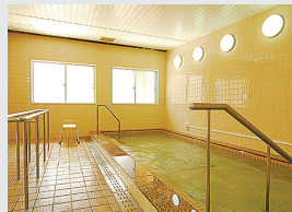
ジャグジー付きの大浴場