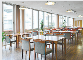
ラウンジ(食事コーナー兼用)