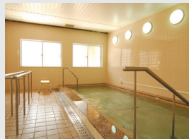
ジャクジー付きの大浴場