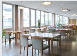
ラウンジ(食事コーナー兼用)