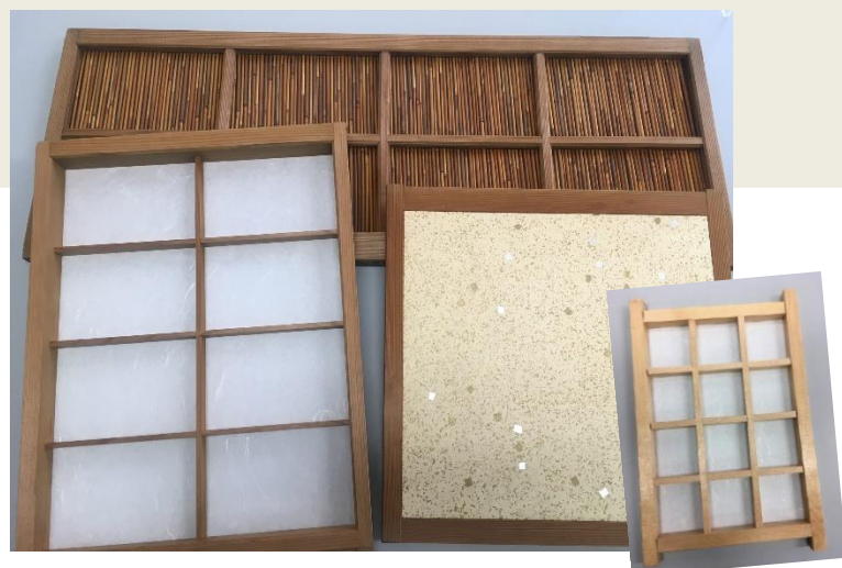
障子, すど, 襖