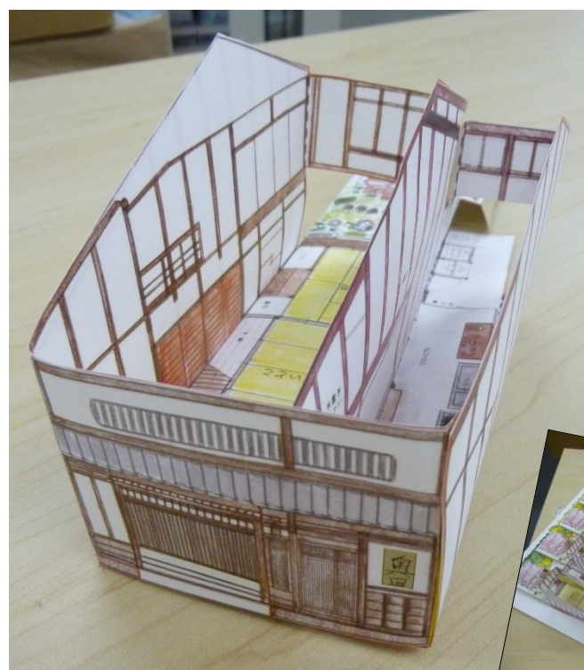
クラフト模型で作った街並み