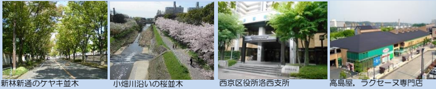
新林新通のケヤキ並木

また、洛西支所等の行政機関や小・中・高校等の教育機関・救急総合病院等の医療機関などの生活施設のほか、ラクセーヌ専門店・高島屋洛西店のほか、スーパーなどもあり、買物にも便利な街です。