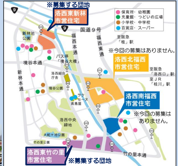
高島屋、ラクセーヌ専門店