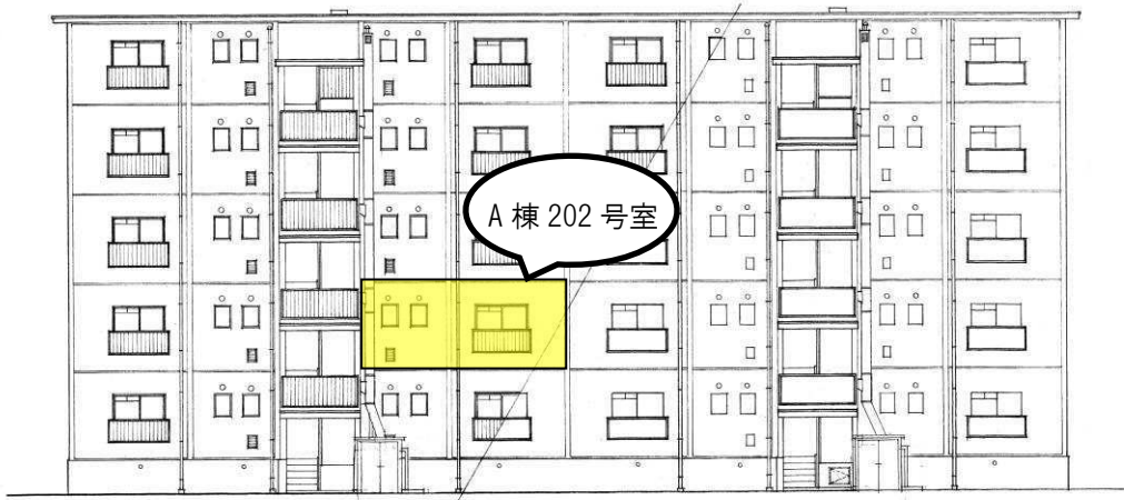
A棟募集住戸 2階202号室