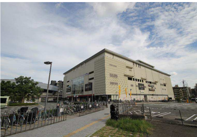
BiVi（映画館等複合商業施設）