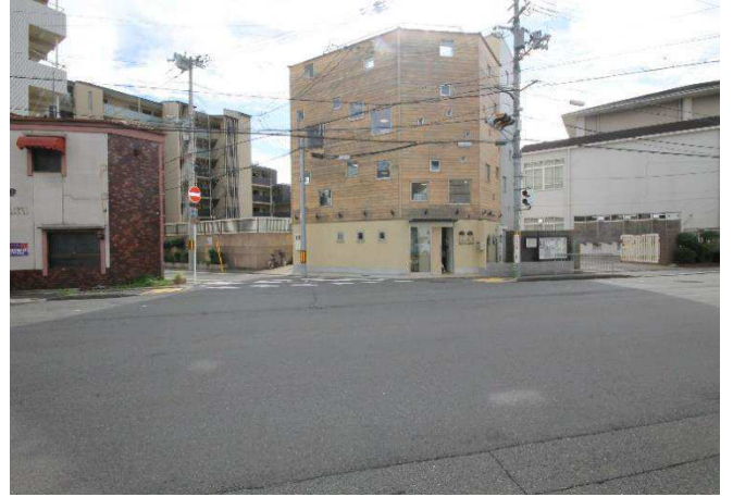
朱雀みぎわ学童保育所