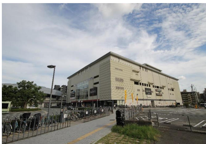
B i V i（映画館等複合商業施設）