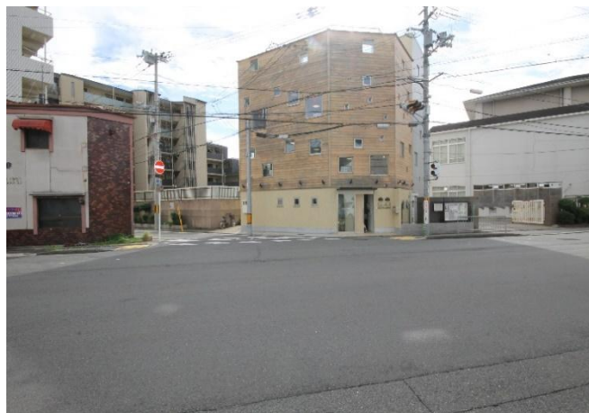
朱雀みぎわ学童保育所