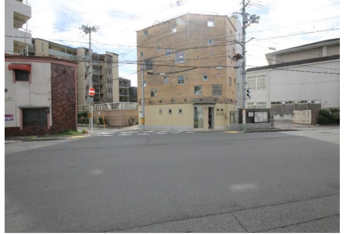
朱雀みぎわ学童保育所