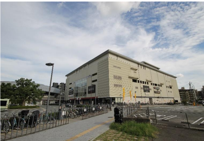
B i V i (映画館等複合商業施設)