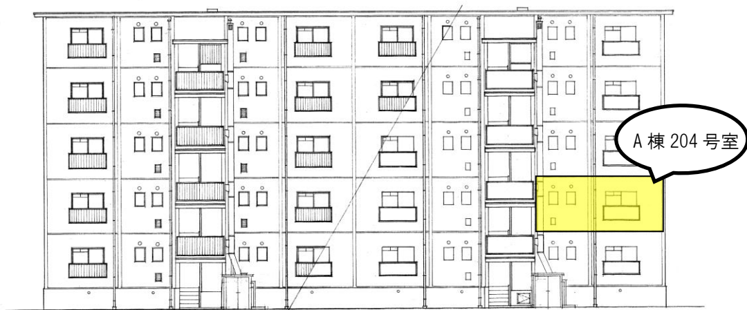
A棟募集住戸 2階 204号室