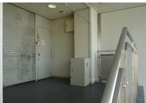
吹抜け階段を昇ったところ