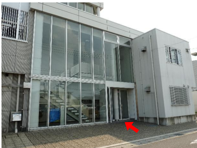
1階エントランス 吹抜けの階段を昇ったところに、 メインの入口があります