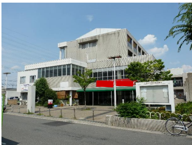
久我の杜センター全景 1, 2階が店舗 3, 4階が賃貸住宅