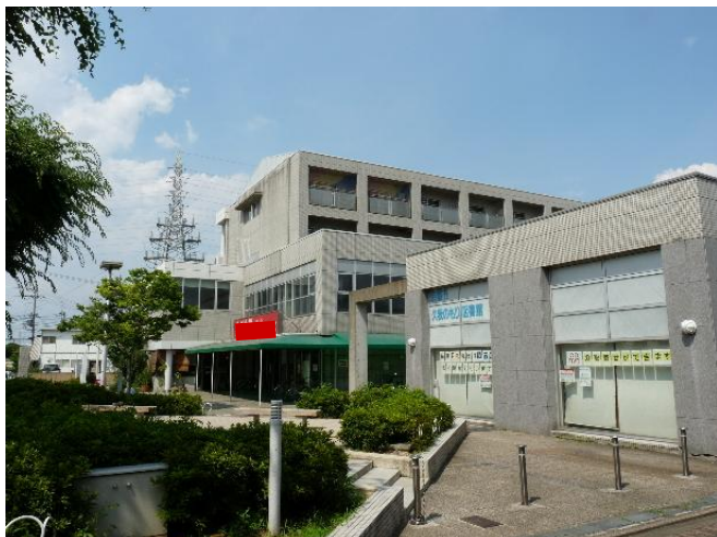
久我の杜センター 手前が久我の杜図書館